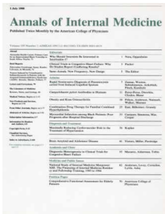
Diseño de la carátula actual de Annals of Clinical Medicine , desde 1988.